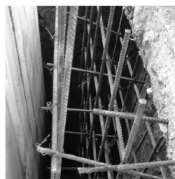
Применяется для усиления и наращивания конструкций