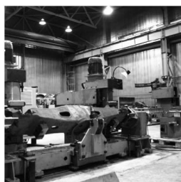
Крепление технологического оборудования