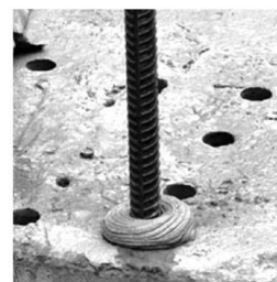
Устройство арматурных выпусков