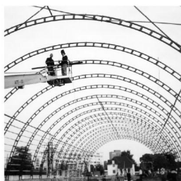
Применяется на общестроительных объектах для крепления металлоконструкций